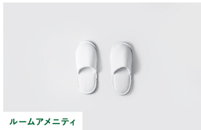
ルームアメニティ