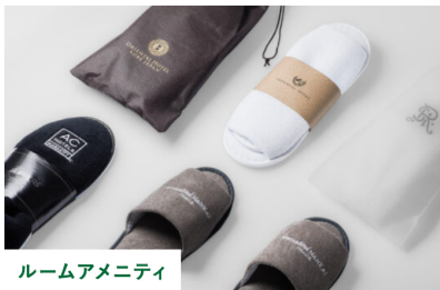
ルームアメニティ